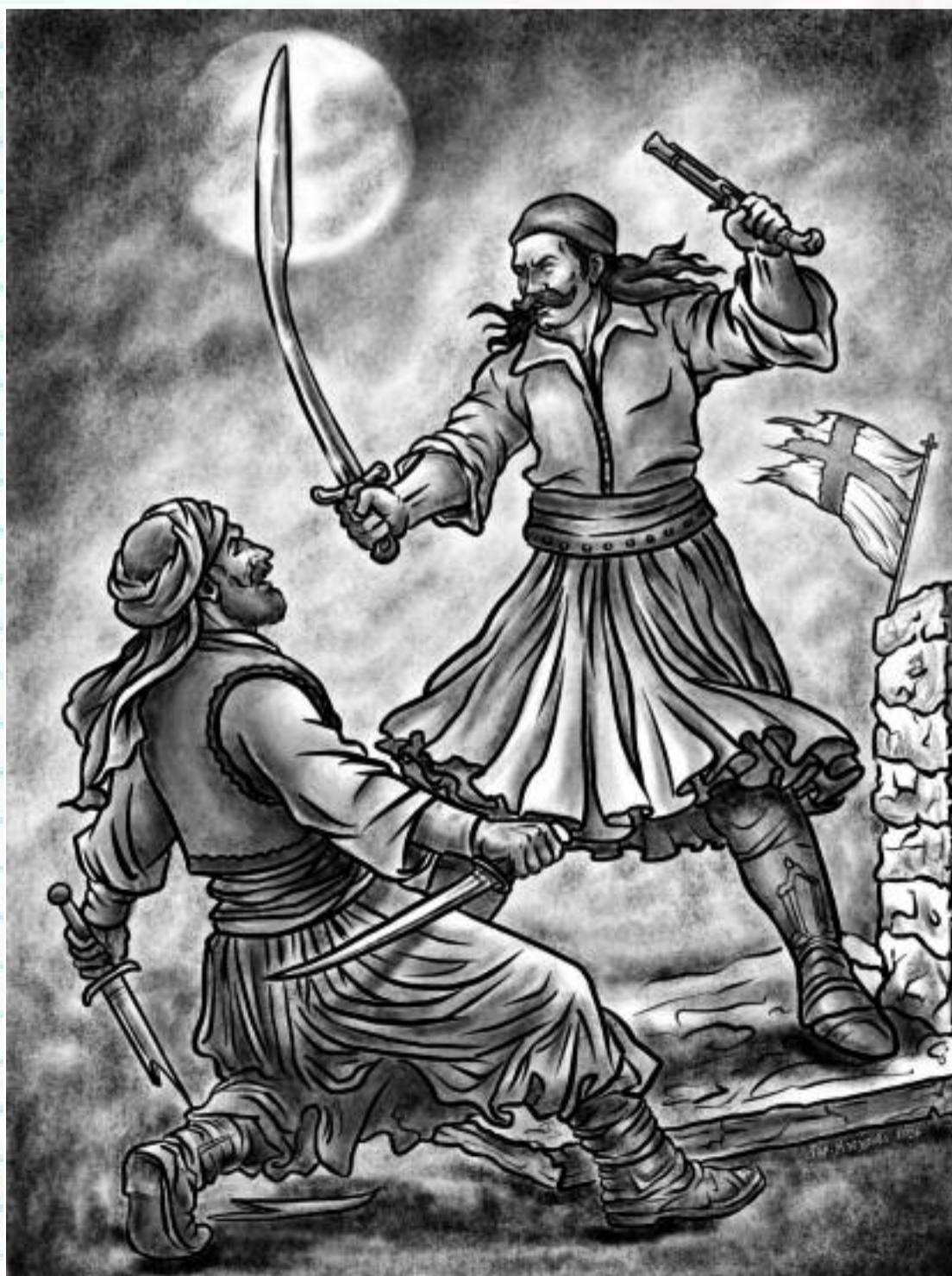
"Ἡ ἀσημένια πάλα", τοῦ Γεράσιμου Μοσχονᾶ.

Ἀφιέρωμα - 200 χρόνια ἀπὸ τὴν Ἑξοδο τοῦ Μεσολογγίου.