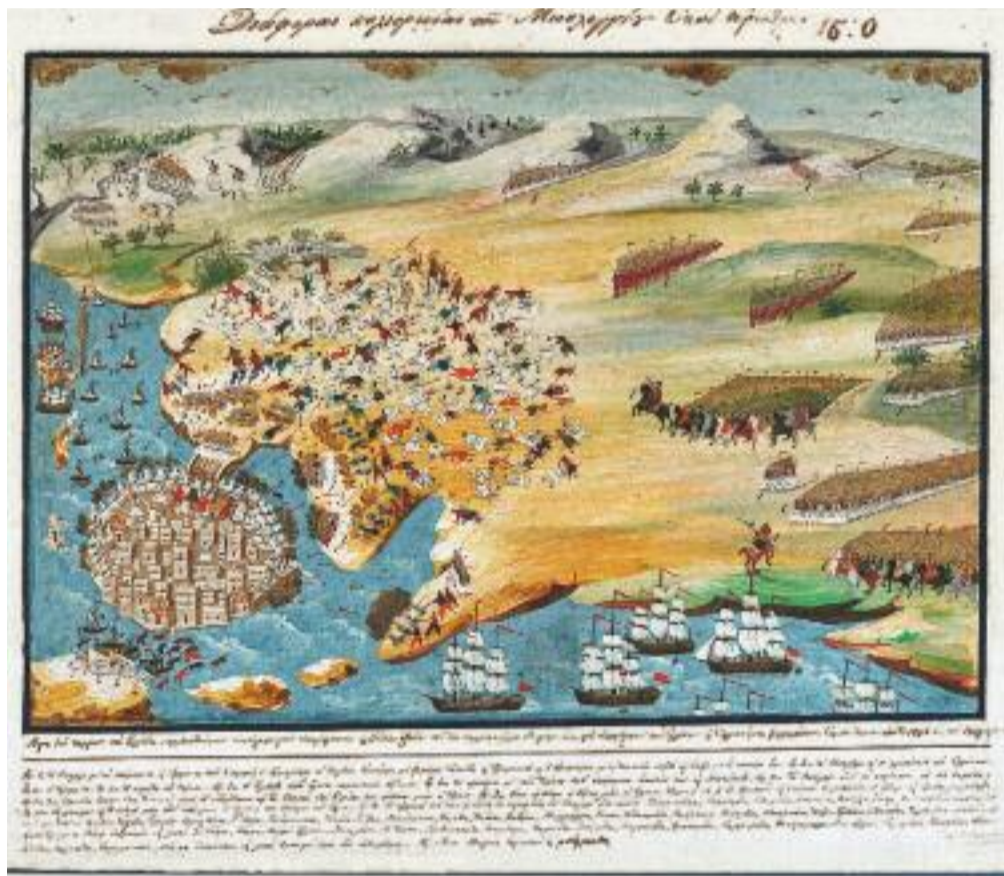
Διάφοροι πολιορκία του Μεσολογγίου -Πίνακας του Παναγιώτη Ζωγράφου με την καθοδήγηση του Μακρυγιάννη.

Θα πεθάνει στις 13 Δεκεμβρίου 1880. Τριάντα δύο χρόνια μετά, στις 5 Νοέμβρη 1912, ένας άλλος Σπυρομίλιος, εγγονός του αδελφού του Γιάννη, ο ταγματάρχης Σπύρος Σπυρομίλιος, έμπαινε ελευθερωτής στη Χιμάρα για μια πρόσκαιρη, αλίμονο, χαρά.