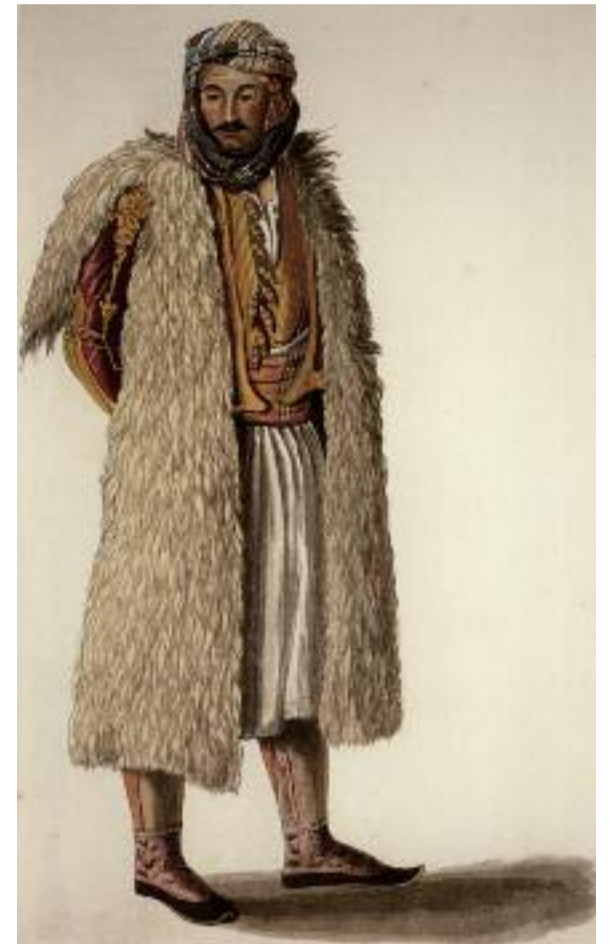
Σουλιώτης - έγχρωμη χαλκογραφία (1822) του Τζόζεφ Κάρτραϊτ.