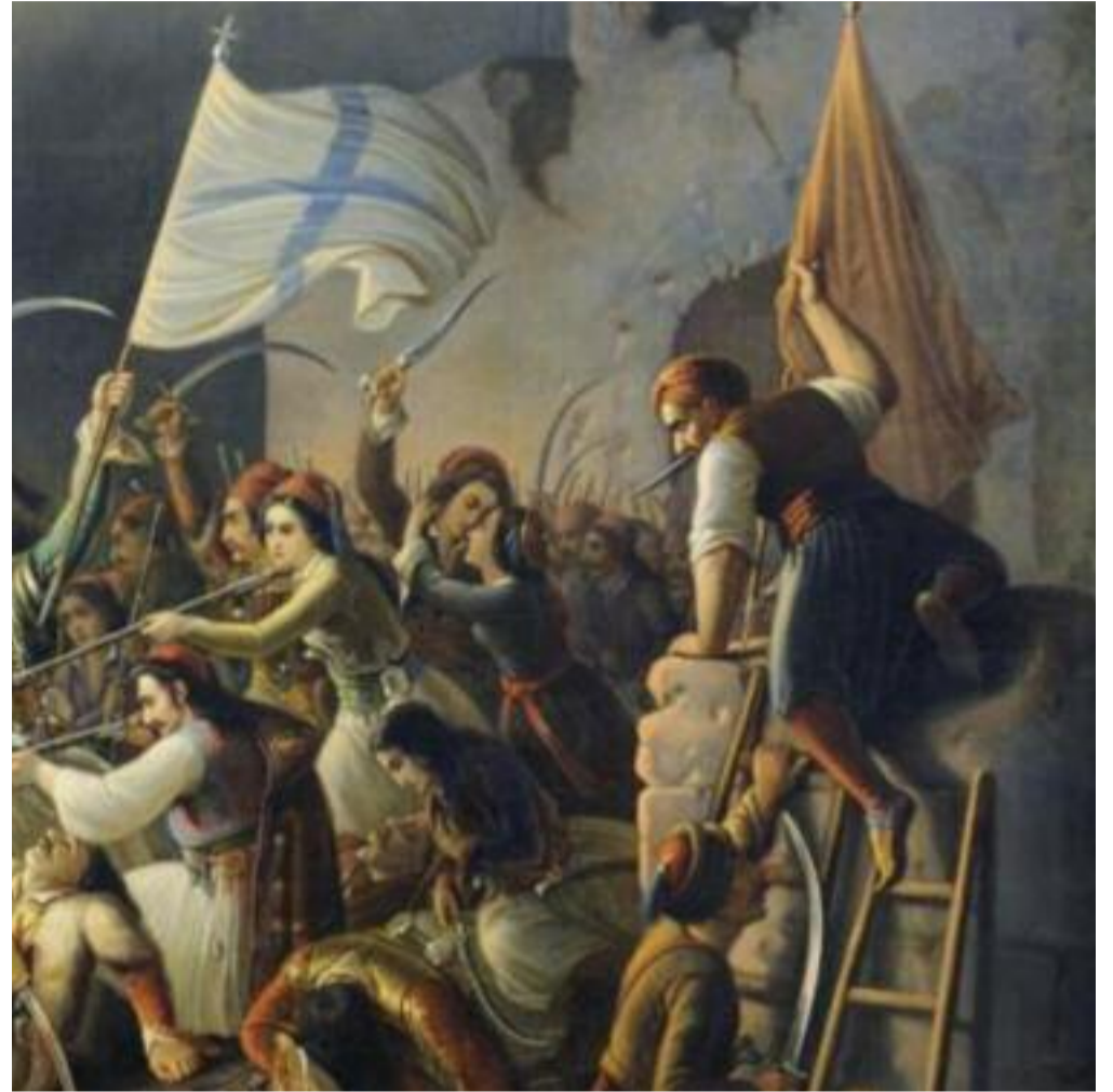
Ἡ Ἐξοδος τοῦ Μεσολογγίου (λεπτομέρεια), πίνακας τοῦ Θεόδωρου Βρυζάκη. Ἐθνικὴ Πινακοθήκη τῆς Ἑλλάδας – Μουσεῖο Ἀλεξάνδρου Σούτζου.

«Φρίκη τὸν λαὸν κατέλαβε μεγάλη», ἀλλὰ καὶ ἡ ἴδια ἡ γῆ ἐφρίξε, σημάδι