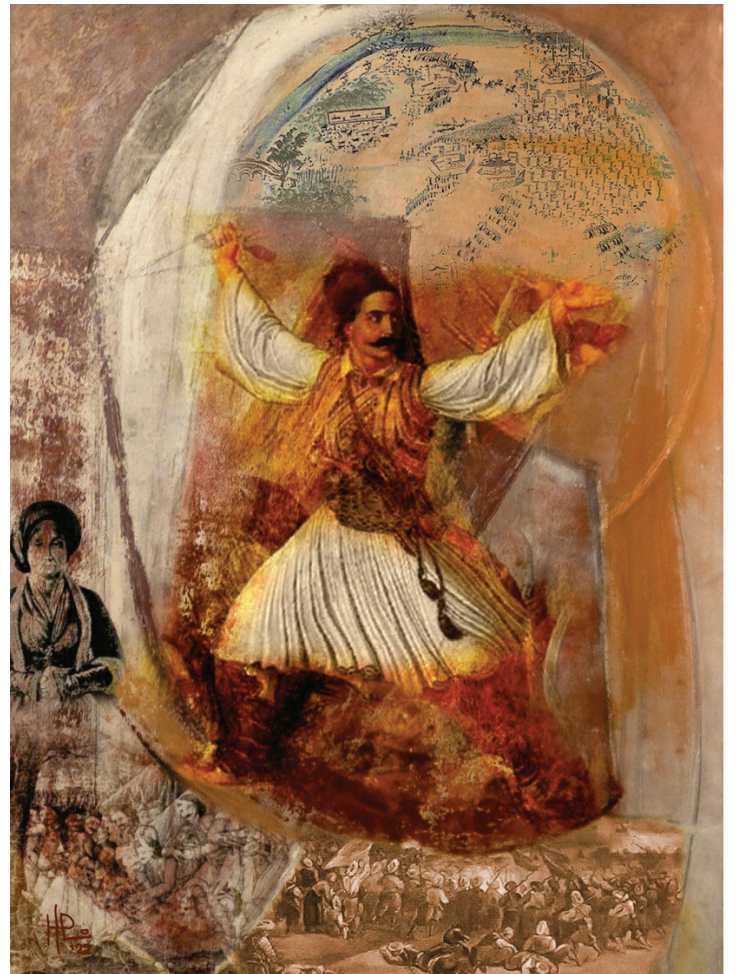
A. Ἡρῶ Νικοπούλου, «Μάρκος Μπότσαρης», μεικτὴ τεχνικὴ σὲ καμβά, 70X50 ἐκ.

Ἔνας τρίτος λόγος, πού ἔχει σχέση μὲ τὴν περιοχὴ, τὴν Εὐρυτανία, τὸ Καρπενήσι, εἶναι ὅτι ἡ μεταγραφή τῶν χειρογράφων τῆς μετάφρασης τοῦ Παπαδιαμάντη, στὴ μοναδικὴ ἐκδοσὴ, ἐκείνης τοῦ 2008, μὲ ἐκδότῃ τὸ Ἴδρυμα τῆς Βουλῆς τῶν Ἑλλήνων γιὰ τὸν Κοινοβουλευτισμὸ καὶ τὴν Δημοκρατία, ἔγινε στὸ Καρπενήσι ἀπὸ τὸν τὸν Εὐβοεᾶ ἐκπαιδευτικὸ, φιλόλογο Ἄγγελο Μαντᾶ, ὅταν αὐτὸς ὑπηρετοῦσε ὡς ἐκπαιδευτικὸς στὸ Καρπενήσι. Ὁ ἴδιος ὁ Ἄγγελος Μαντᾶς, ὁ ὁποῖος ἔκαμε τὴν μεταγραφή καὶ εἶχε τὴν φιλολογικὴ ἐπιμέλεια τοῦ ἄθλου τῆς ἐκδόσης τῆς μετάφρασης τοῦ ἔργου τοῦ G. Finlay ἀπὸ τὸν Παπαδιαμάντη, μᾶς ἀποκάλυψε πὼς μεγάλο μέρος τῆς μεταγραφῆς τὸ ἔγινε –ἀπὸ ἀντίγραφα τῶν χειρογράφων τῶν ΓΑΚ– στὸ Καρπενήσι, τὴν περίοδο 2003-2007. Στὸ παγωμένο Καρπενήσι, στὴ σκιά τοῦ Βελουχιοῦ, κοντὰ στὰ ἱστορικὰ Ἄγραφα τοῦ Κατσαντώνη καὶ τοῦ Καραϊσκάκη, στὸ Καρπενήσι τοῦ Μάρκου Μπότσαρη, ἐκεῖ πού γιὰ πρώτη φορὰ εἶδε τὸ φῶς τοῦ ἡλίου ὁ μέγας Ζαχαρίας Παπαντωνίου, ὁ Ἄγγελος Μαντᾶς ἄπλωνε τὸν Παπαδιαμαντικὸ λόγον στὸ