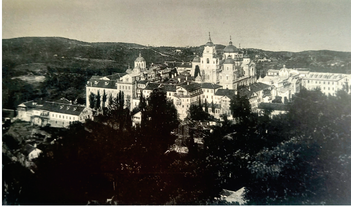
Γερομόναχος Στέφανος, «Ἅγιον Ὄρος. Ἡ σκῆτη τοῦ Ἁγίου Ἀνδρέου», Λεῶματα τοῦ Ἁγίου Ὄρους Ἄθω , Κελλίον Ἀποστόλου Θωμᾶ, Ἄθως 1913, σ. 28.