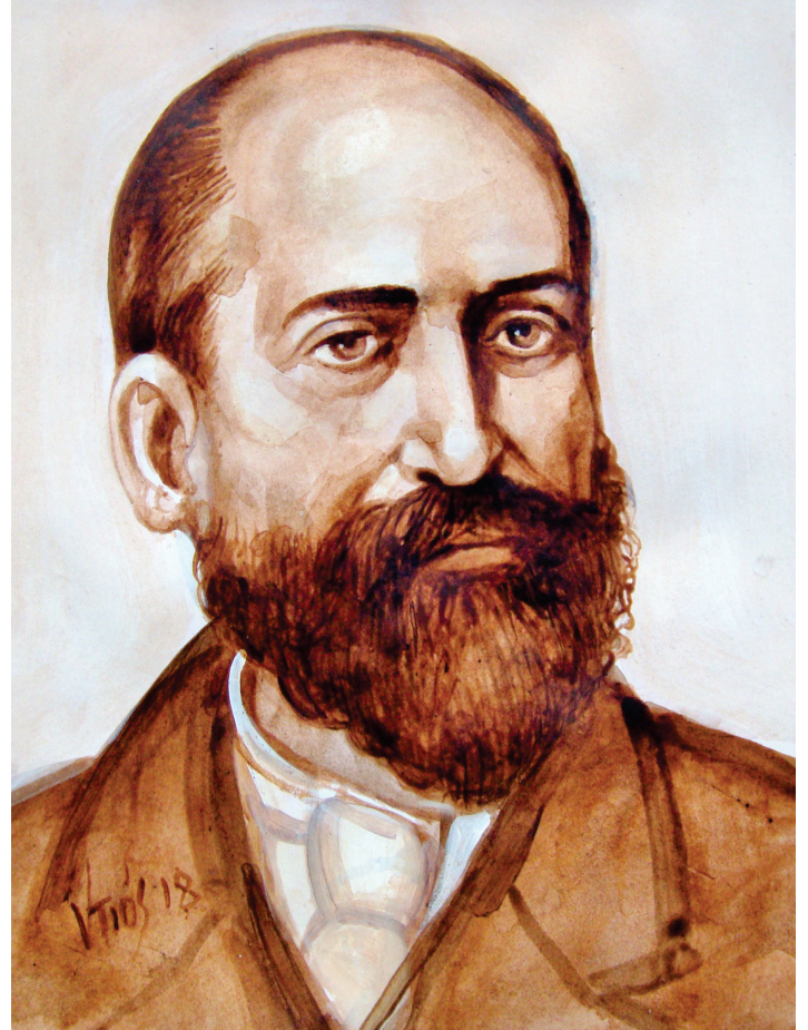
Ἀλέξανδρος Μωραϊτίδης, ἔργο (2018) τοῦ Κώστα Ντιό.

Τὸ χρονογράφημά του τὸ δημοσιεύει μὲ τὸ σύνθημα γιὰ τὰ ταξιδιωτικὰ του ἄρθρα ψευδώνυμο, «Ὁ ταξιδιώτης». Μετὰ τὸ πέρας